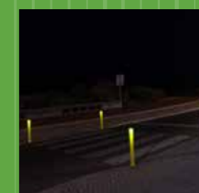
Quatro pilaretes amarelos: iluminação de passadeiras pedonais