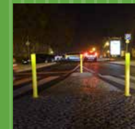
Três pilaretes amarelos: iluminação de passadeiras pedonal