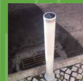
Pilarete Pedonal durante o dia

Dispõe de uma garantia de 12 meses como padrão.